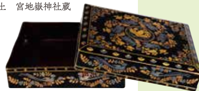
金銀平脱皮箱(再現模造品) 昭和時代(20世紀) 奈良国立博物館蔵