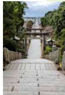
宮地嶽神社の参道