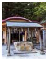
宮地嶽神社 奥之宮八社 三番社・不動神社