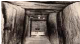
「宮地嶽岩屋不動」 明治時代末～大正時代前期の絵葉書から