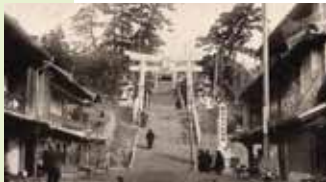
「宮地嶽神社正面の景」 明治時代末～大正時代初期の絵葉書から

大陸との交流の窓口であった玄界灘沿岸には、海を舞台に活躍する海人集団が存在しました。海を望む宮地嶽神社境内に築造された「宮地嶽古墳」被葬者は、まさに海を治めた首長といえます。副葬された金銅製馬具や金銅装頭椎大刀などの黄金に輝く絢爛豪華な品々は美の精華と評されます。本展では「国宝 宮地嶽古墳出土品」や周辺の古墳出土品、「正倉院宝物」の再現模造品をとおして、古代の美と技について紹介します。