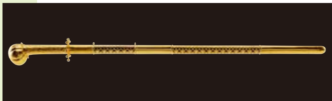
金銅装頭椎大刀(復元品) 九州国立博物館蔵