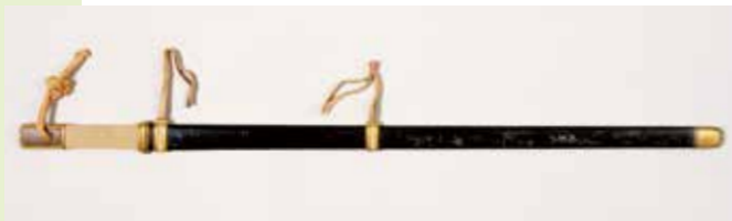
黄金荘大刀(再現模造品) 明治8年(1875) 奈良国立博物館蔵