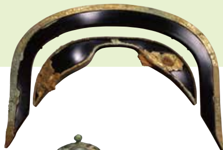
《国宝》金銅鞍金具残欠(後輪) 宮地嶽古墳出土 宮地嶽神社蔵

当館は新型コロナウイルス感染症拡大防止に取り組んでいます。皆様のご理解とご協力をお願いします。