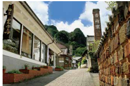
大川内山(伊万里市)