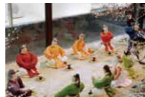
梅花の宴:古都大宰府保存協会