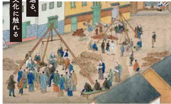
《唐蘭館絵巻 商品計量図(部分)》 長崎歴史文化博物館蔵