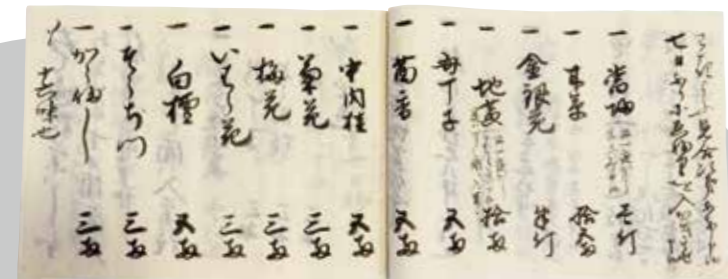
保命酒のレシピ 中村家文書「名酒家傳記」 福山市瀬の浦歴史民俗資料館蔵

Onojo Cocoro-no-furusato-kan City Museum