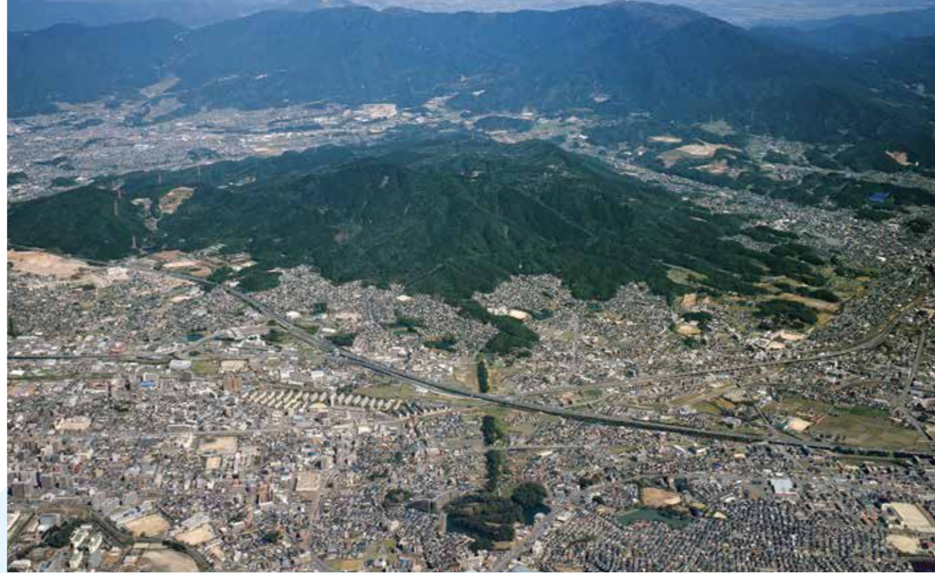
水城跡・大野城跡