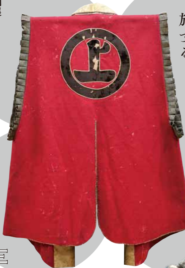
猿々陣羽織 個人蔵 ※展示は複製品