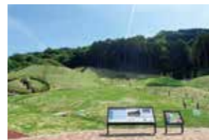
善一田古墳群

日時・コース | ①太宰府市コース 令和4年5月7日(土) ②春日市・那珂川市コース 令和4年5月29日(日) ③筑紫野市・基山町コース 令和4年6月11日(土) ④宇美町・大野城市コース 令和4年6月12日(日) 時間はいずれも午後1時～午後4時30分 定 員 | 各回15名(応募者多数の場合は抽選) 出発・解散場所 | 大野城心のふるさと館 参加費 | 無料(別途特別展観覧料が必要) 申込期間 | 令和4年4月15日(金)～5月1日(日)必着