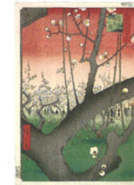
◀歌川広重(名所江戸百景 亀戸梅屋舗)(再現)