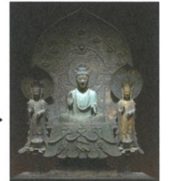
◀法隆寺釈迦三尊像(再現)

※新型コロナウイルス感染症対策のため、特別展への入場を一時的に制限する場合があります。特別展ご観覧に際しては「特別展事前電話予約」をいただいた方から優先してご観覧いただけます。詳しくは心のふるさと館までお問い合わせください。