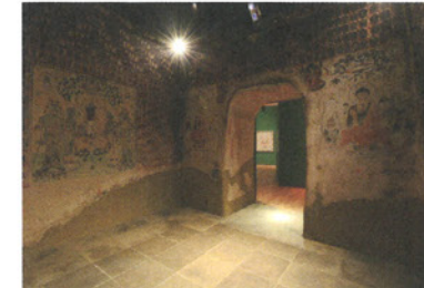
◀敦煌莫高窟 第57窟(再現)