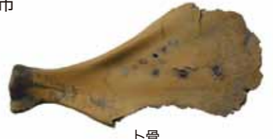
ト骨 (ヒイ様の占いの道具：画像は九州歴史資料館提供)