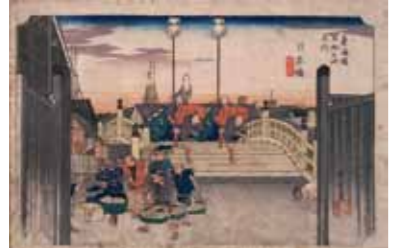
「東海道五十三次之内 日本橋」

日時 前期：令和7年4月9日(水)～5月6日(振休・火) 後期：令和7年5月8日(木)～6月12日(木) 午前9時～午後7時 会場 2階 ミニテーマ展示