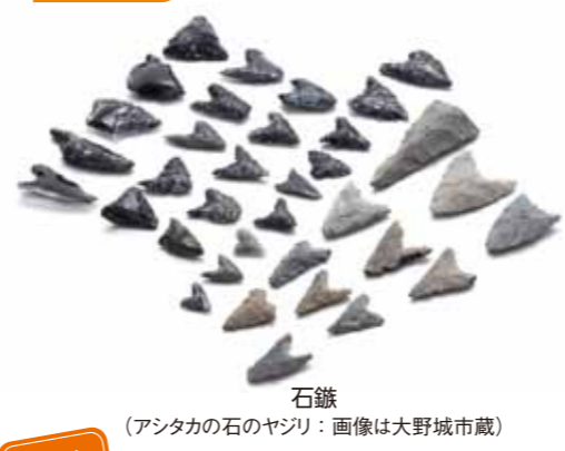
石鏃 (アシタカの石のヤジリ：画像は大野城市蔵)

会場 3階 企画展示室 観覧料 一般500円(450円)、高・大学生100円(50円)、中学生以下無料 ※( )内はここふる友の会会員料金・20名以上の団体料金 ※令和7年5月18日(日)は「国際博物館の日」のため観覧料無料 主催 大野城心のふるさと館、大野城市