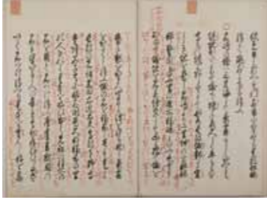
『黒田家譜』巻14

日時 令和7年3月4日(火)～4月13日(日) 午前9時～午後7時 会場 M2階 大野城コレクション