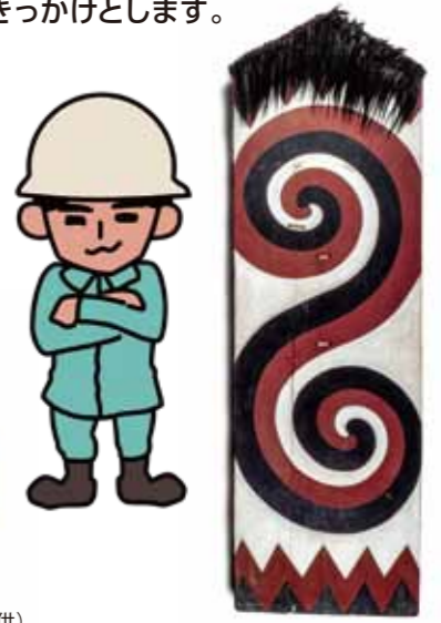
隼人の盾(復元品) (村のじい心の盾)