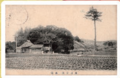
元寇古跡 水城 (明治時代末頃)