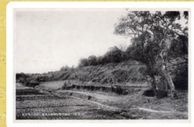
元寇の昔を物語る史跡 水城大堤の趾 (昭和前期)