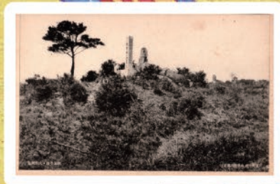
四王寺・大野城址 (昭和前期)