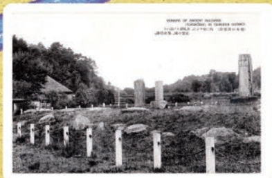
陽は和やかに薫風静かに流れる 追懐の地 都府楼跡 (昭和初期)