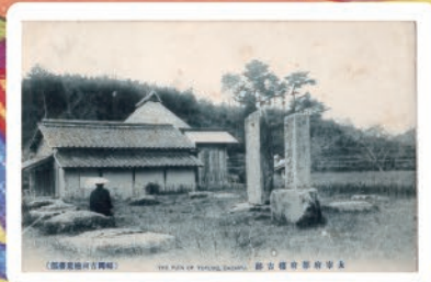
筑前都府楼 (明治時代末頃)