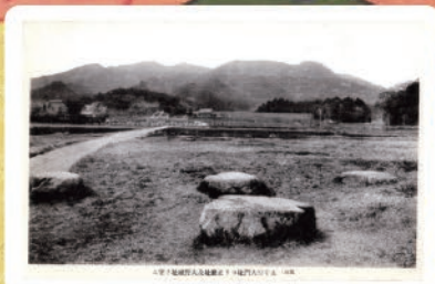
筑前大宰府址全景及大野城遠望 (大正時代後期～昭和時代初期)