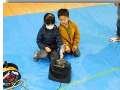
風見鶏って、どうして風が吹いてくる方向を向くの??