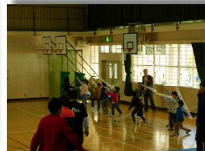
傘袋ロケット!! 飛んでけー!! どうしたらまっすぐ飛ぶのかな?